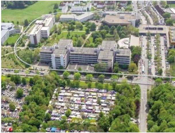
TU Dortmund, Blick auf unser Tagungsgebäude (Mitte) und den Parkplatz rechts daneben. Vorne auf dem großen Parkplatz findet samstags Flohmarkt statt.